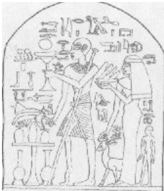
Fig.1 The relief showing patient suffered from polio 1)

人と病原微生物との付き合いは非常に長い。古代エジプト王朝時代のレリーフにもその痕跡が残っている。Fig.1は、片足が細くなって、杖を突いている人のレリーフであるが、これは小児マヒに罹患した人であるというのが定説である。